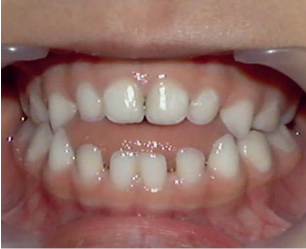
Yoğun emzik kullanımı sonucu öne doğru aralıklı gelişmiş ön dişler

Emziğin uzun süre boyunca çocuğun ağızında kalması, diş ve çene bozukluğu oluşumunu tetiklemektedir. Bunun sonucunda görülen tipik bir diş ve çene bozukluğu ise ön dişlerin öne doğru aralıklı şekilde gelişmesidir.