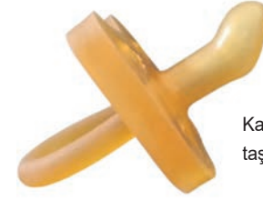
Kalın ağızlıklı kiraz taşından emzik