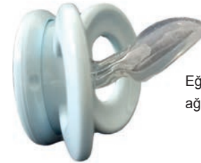
Eğimli ve ince ağızlıklı emzik