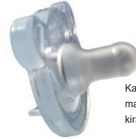
Kalın ağızlıklı ve sağlam malzemeden üretilmiş kiraz taşından emzik