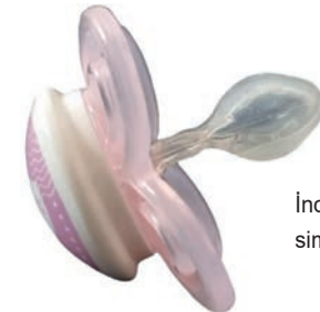
İnce ağızlıklı simetrik emzik